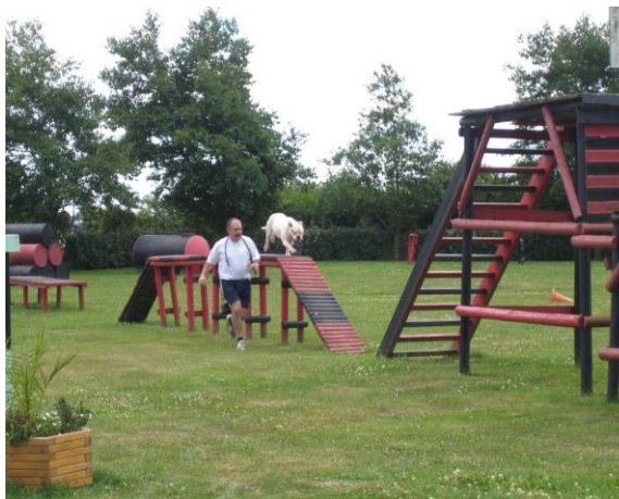
Pension canine de Plouguerneau

Les balades en bateau du lundi soir restent très attractives pour nos visiteurs (environ 350 passagers par été) pour autant que la météo offre de beaux couchers de soleil !!